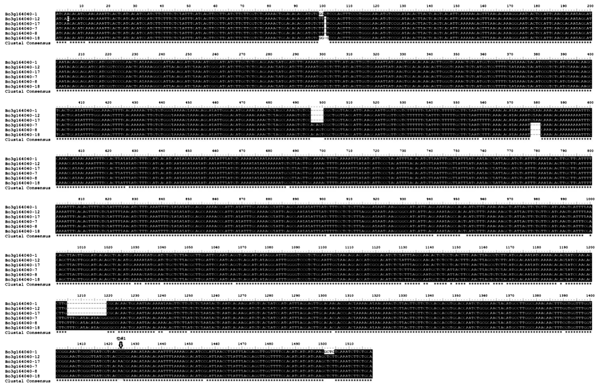
图 2 抗感材料中 Bo3g164040 基因部分序列比对

材料 BDH3 与 3 份感病材料序列一致性高达 97.84%, 共存在 45 处 SNP 和 3 处 Indel 变异; 抗河南新野菌种材料 SW-109、SW-110 与 3 份感病材料序列一致性为 98.18%, 同样存在 45 处 SNP 和 3 处 Indel 变异。3 份抗病材料与 3 份感病材料在位点 1 有 2 个碱基的差异, 其中抗病材料为 AA, 感病材料为 CC(图 2)。