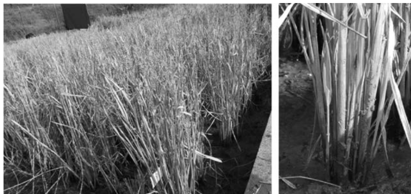
图1 初春时 SH5 的田间越冬再生表型