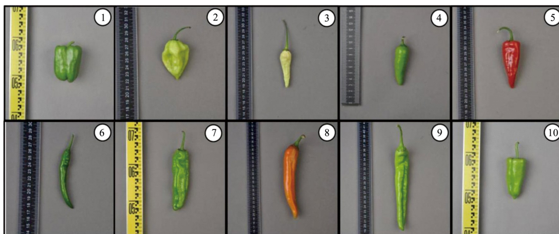
数字1~10分别代表聚类分析十大类I~X

The numbers 1-10 in the figure represent typical fruits of the ten categories I~X of cluster analysis