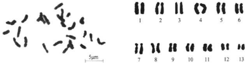
图1 人心果的染色体形态与核型图

人心果和蛋黄果的核型图见图1和图2,核型分析见表1和表2。结果表明:2种果树均为小染色体,2倍体;人心果体细胞含26条染色体,由中部着丝粒染色体(m)和近中部着丝粒染色体(sm)组成,核型类型为2B型;蛋黄果体细胞含有28条染色体,亦由中部着丝粒染色体(m)和近中部着丝粒染色体(sm)组成,核型类型为1A型。人心果和蛋黄果除染色体条数不同外,其染色体相对长度组成也不相同,人心果染色体相对长度组成为 2L + 12M_2 + 8M_1 + 4S ,蛋黄果染色体相对长度组成为 2L + 10M_2 + 16M_1 。前者的不对称系数为61.71%,后者的不对称系数为59.193%。可见蛋黄果的染色体相对人心果是对称的、稳定的。