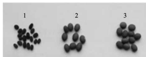
1:典型野生型;2:半野生 201107-4;3:半野生 201107-30

在宁夏搜集到 2 份半野生类型(编号 201107-4,201107-30),百粒重分别为 4.87 g、5.46 g,种皮色均为黄绿色(图 1)。