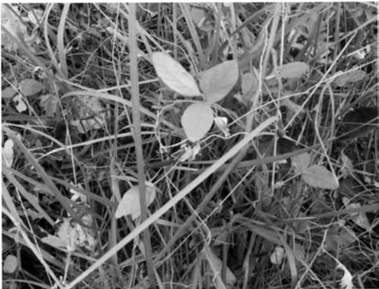
图 2 青铜峡市晚熟野生大豆 201107-34 Fig. 2 Late-maturing wild soybean (201107-34) in Qintongxia, Ningxia

2.3 晚熟生态型 在宁夏青铜峡市广武乡广武村发现晚熟类型(宁夏 201107-34),采集时比该区域野生大豆明显晚熟(图 2),此时其他野生大豆都已经全部落叶。