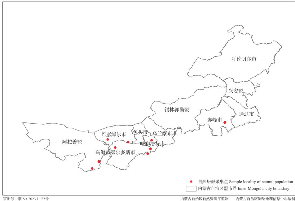
图1 内蒙古10个酸枣自然居群分布