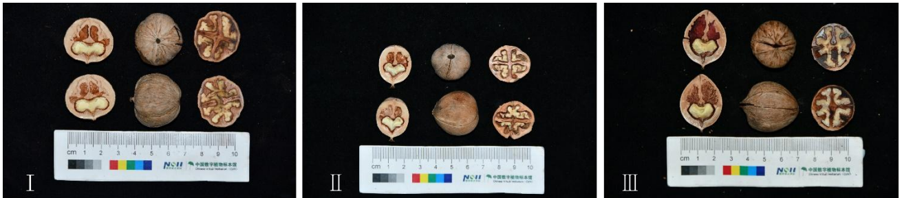
图 2 湖南山核桃 3 大类群种质资源坚果