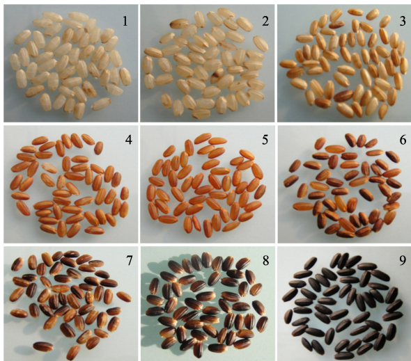
图1 龙锦1号/香软米1578 F 5 家系群糙米粒色等级